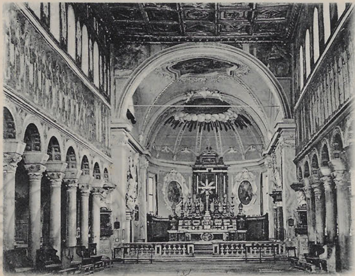
INTERNO DI S. APOLLINARE NUOVO.